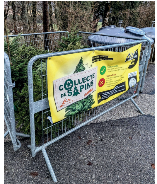
Point de collecte à La Rivière-Enverse. L'hiver dernier, 400 sapins avaient été collectés dans la vallée, en plus de ceux récupérés en déchèterie.

Le service de « gestion des déchets » de la Communauté de Communes collecte ensuite les sapins, puis les achemine à la déchèterie où les conifères seront mélangés à d'autres déchets verts pour être ensuite valorisés sur une plateforme de compostage.