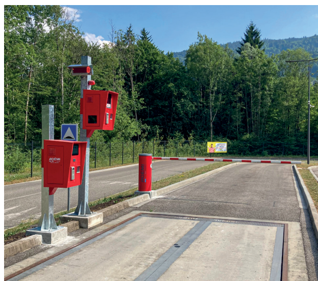
Pont bascule - pour la première et seconde pesée - avec le lecteur de badge « professionnel »