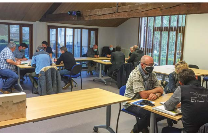
L'un des ateliers de concertation - ici organisé au siège de la Communauté de Communes à Tanninges.

☎ 04 50 47 62 00 ✉ l.lopes@montagnesdugiffre.fr