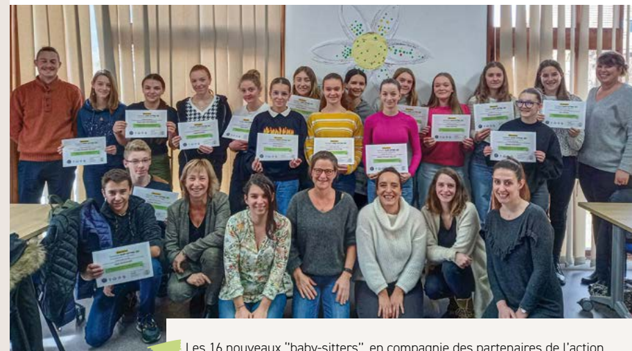
Les 16 nouveaux "baby-sitters", en compagnie des partenaires de l'action.