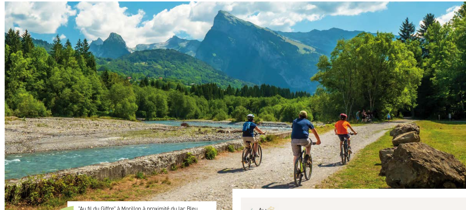
"Au fil du Giffre" à Morillon à proximité du lac Bleu