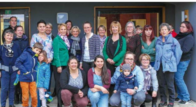
Élus, techniciens territoriaux et assistantes maternelles réunis pour célébrer la mise en place d'ateliers au Pôle Médico-Social de Taninges.