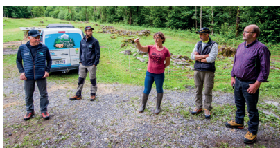
► Edition 2021 : visite sur l'alpage du Frénalay