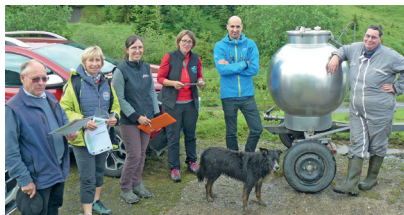
► Edition 2021 : visite sur l'alpage de la Ramaz

Remises lors d'un évènement du territoire, afin de valoriser le travail et les initiatives menées par les alpagistes pour faire face aux enjeux de gestion et de conciliation croissants de ces espaces naturels sensibles.