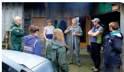
► Edition 2021 : visite sur l'alpage du Croz